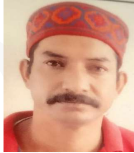
श्री युवराज सदस्य